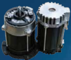
Тяговый и насосный двигатели