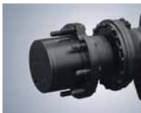
Мокрые дисковые тормоза