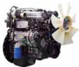
Двигатель HMC D4DD