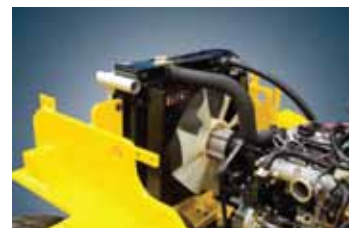
Новейшая система охлаждения